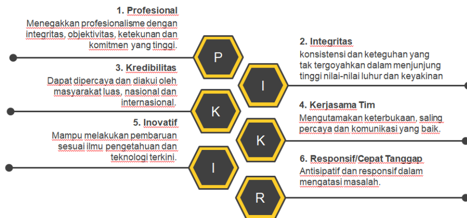
Gambar 2. Budaya Organisasi Badan POM

Budaya organisasi merupakan nilai-nilai luhur yang diyakini dan harus dihayati dan diamalkan oleh seluruh anggota organisasi dalam melaksanakan tugas. Nilai-nilai luhur yang hidup dan tumbuh kembang dalam organisasi menjadi semangat bagi seluruh anggota organisasi dalam berkarya dan berkarya.