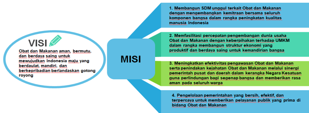
Gambar 1. Visi dan Misi Badan POM